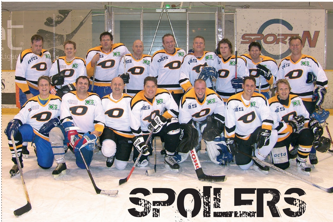
TEKST: BJØRN S. IMS