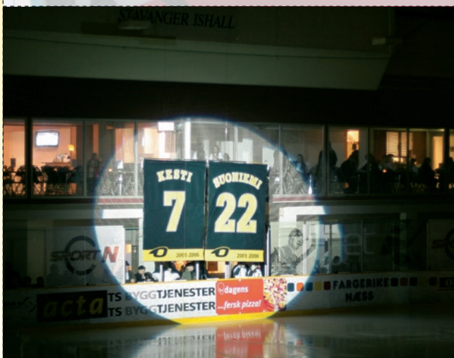
#7 og #22 vil for alltid være fredet i Stavanger Oilers.

Det ble en lang søndagskveld i Siddishallen 4. februar. Køen av store og små som ville sikre seg signerte bilder av hederspersonene var lang.