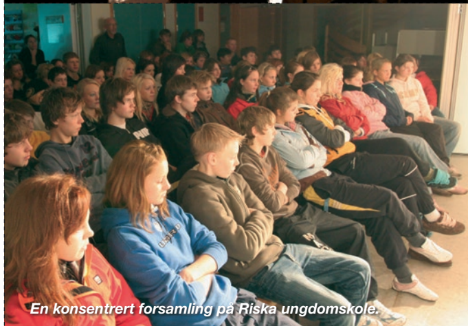
En konsentrert forsamling på Riska ungdomskole.